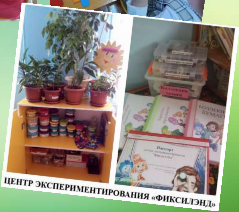
ЦЕНТР ЭКСПЕРИМЕНТИРОВАНИЯ «ФИКСИЛЕНД»