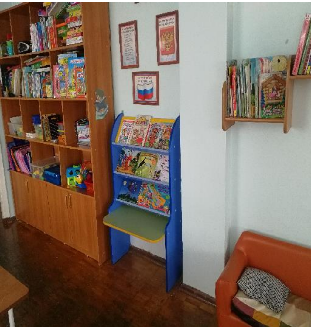
Центр чтения и логики