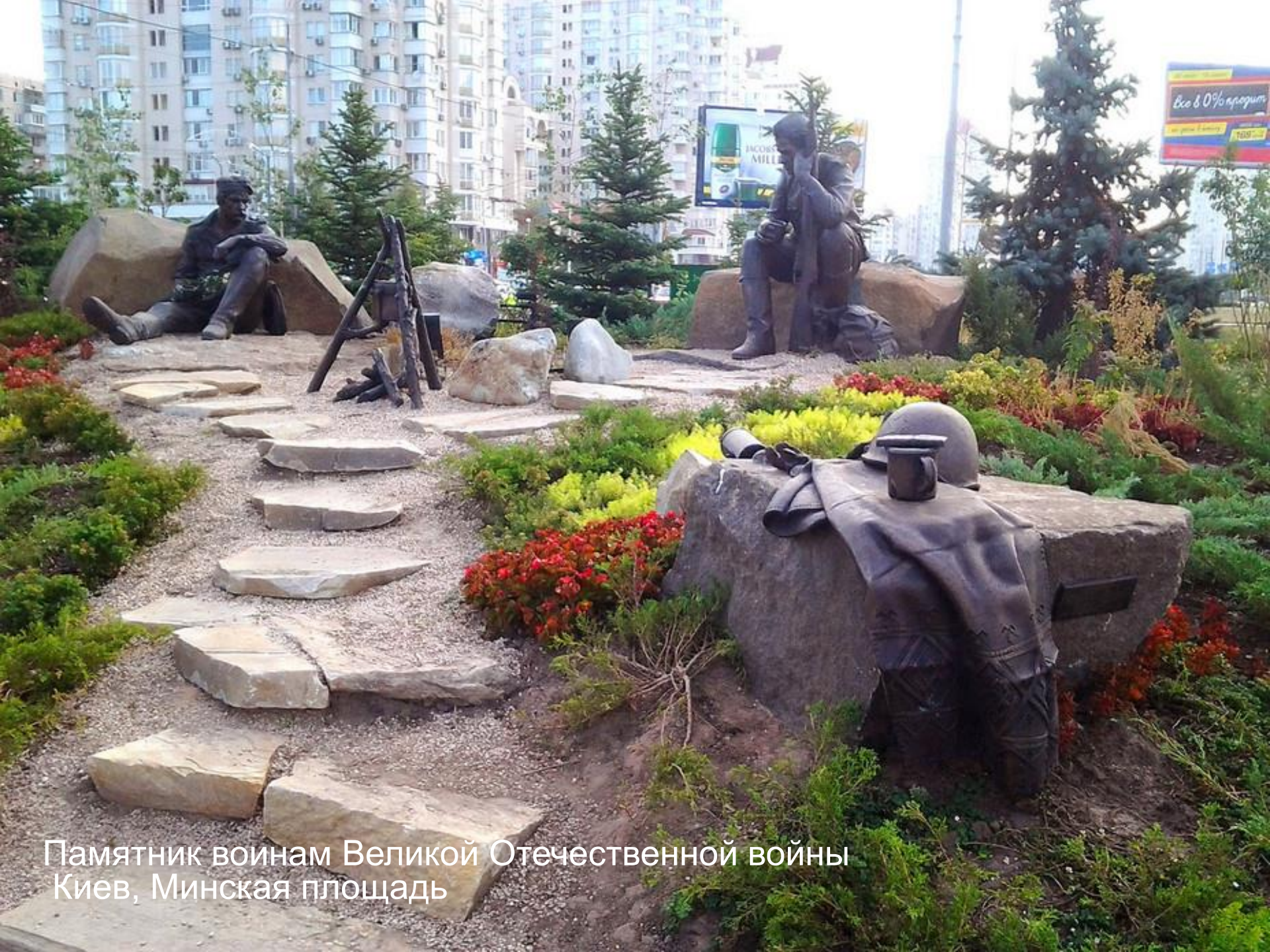
Памятник воинам Великой Отечественной войны Киев, Минская площадь