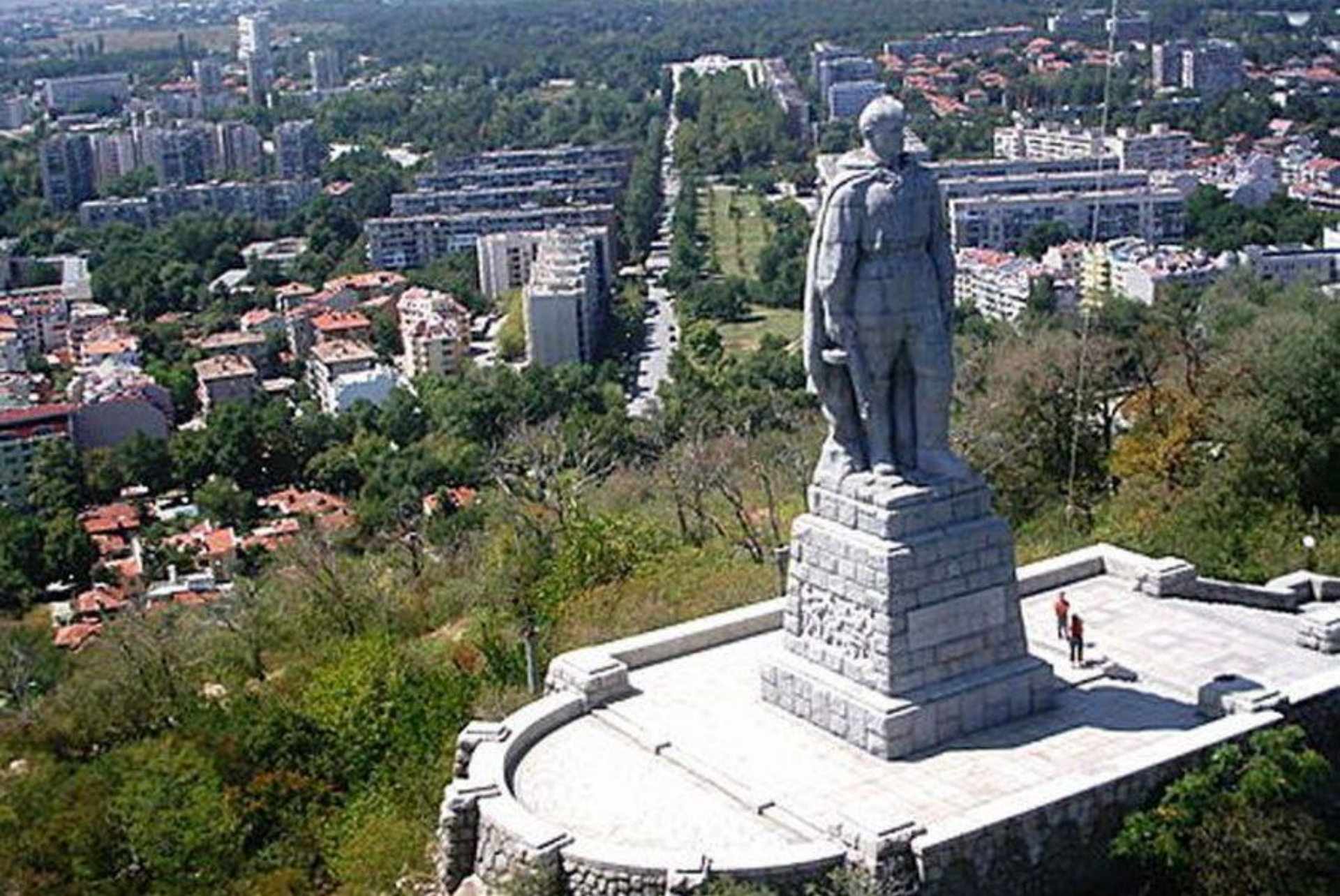
«Алёша» — памятник советскому солдату-освободителю в Болгарии