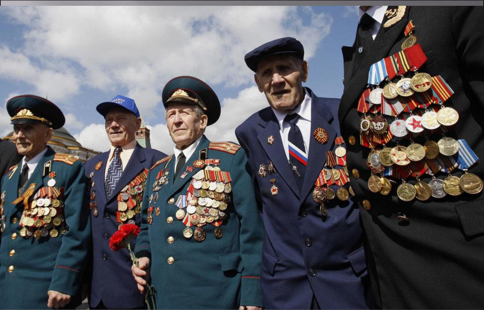
Открывают парад ветераны Великой Отечественной войны